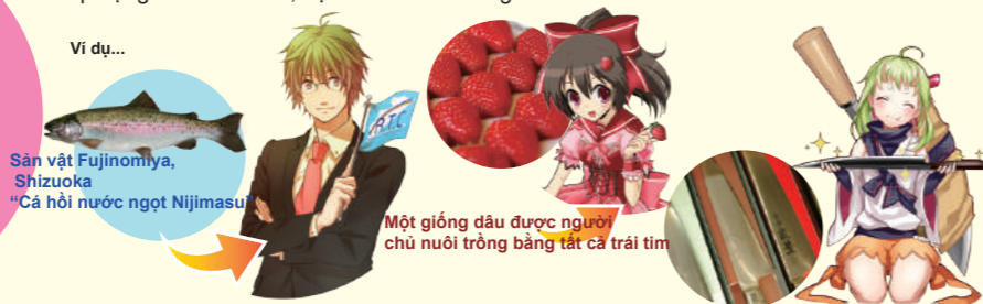
Sản vật Fujinomiya, Shizuoka "Cá hồi nước ngọt Nijimasu"